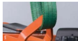
OCHI RIDICARE INCORPORAT